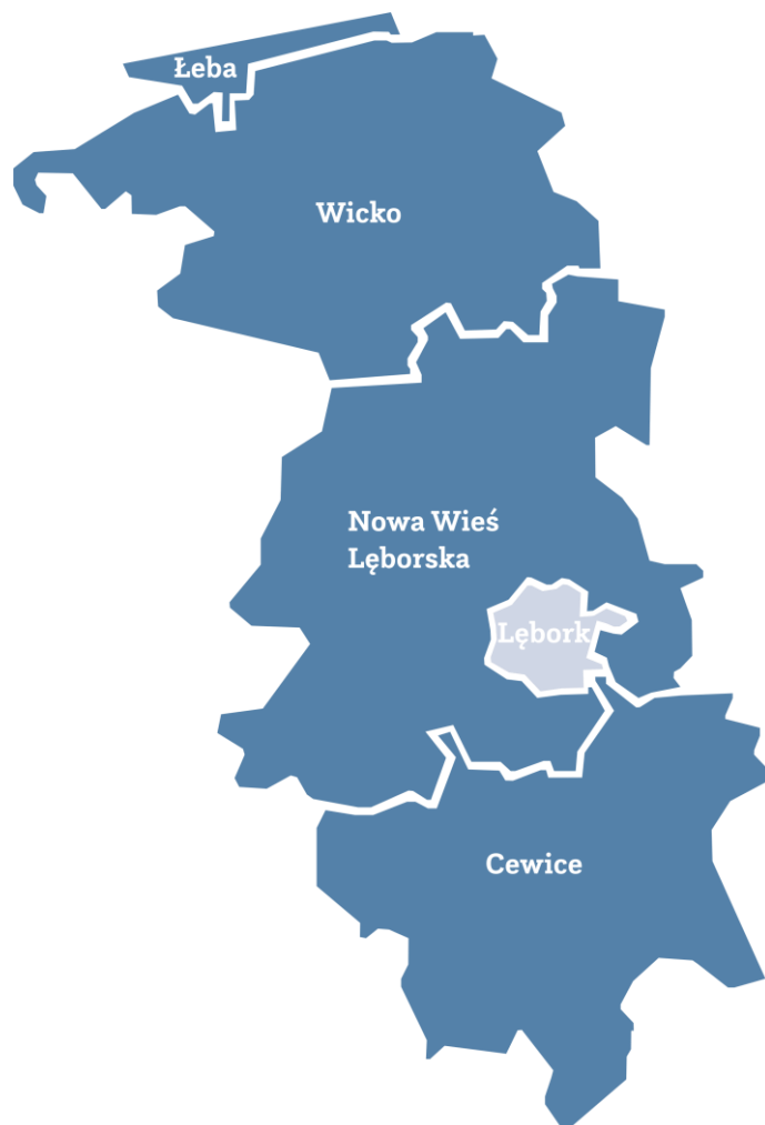
Rysunek 2. Gminy na terenie powiatu łębskiego

Powiat łębski zamieszkuje 60 684 osób – w tym w gminach miejskich: 34 213 osób, w gminach wiejskich: 26 471 osób.